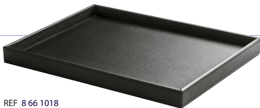
REF 8 66 1018 Plateau Charme UL 1 : 12