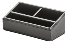
REF 8 66 1020 Porte-sachets Charme UL 1 : 54