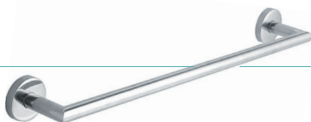
REF 8 99 1440 Porte-serviettes simple UL 1 : 24