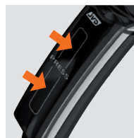
SYSTÈME DE POIGNÉE INTERRUPTEUR BREVETÉ