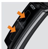
SYSTÈME DE POIGNÉE INTERRUPTEUR BREVETÉ