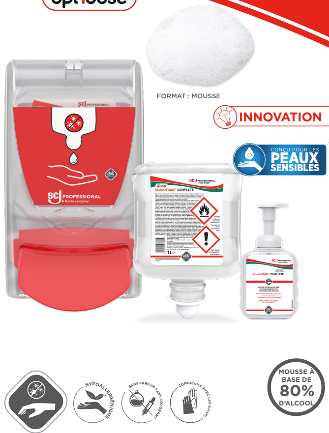
FORMAT : MOUSSE