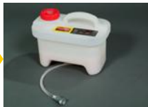
FGQ966000000 – RECHARGE PULSE™