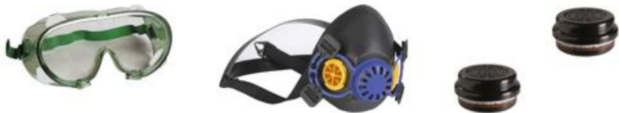
KIT FOURS* 50.702-RHF

Vous devez porter un équipement de protection individuelle adapté.