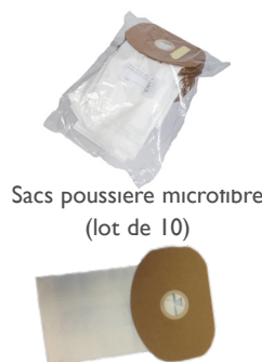
Sacs poussière microfibre (lot de 10)