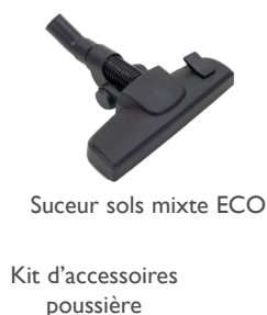
Suceur sols mixte ECO