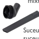
Suceur plat et suceur brosse