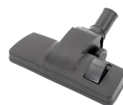
Suceur sols mixte