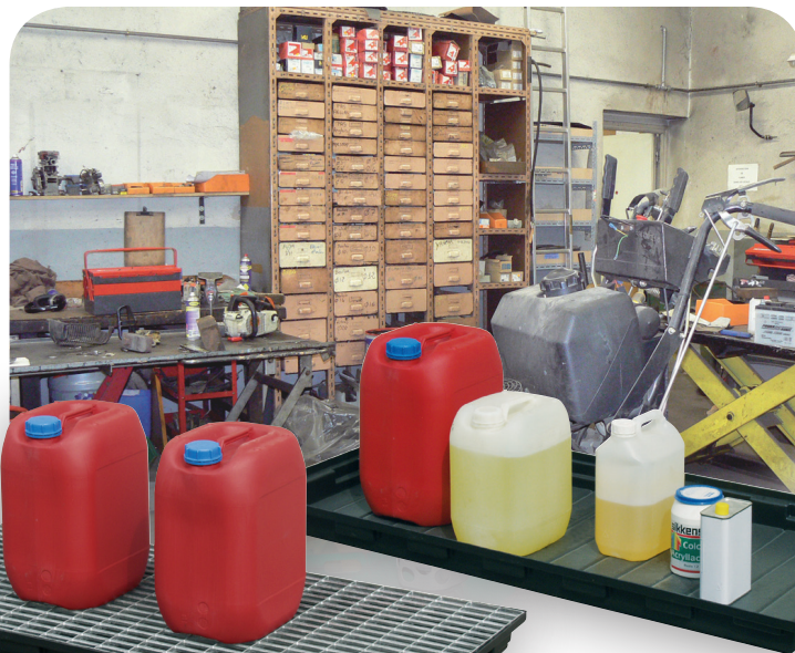
Bac PLAT 40