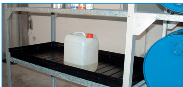
Pour rayonnages 360, 540, 13/20, 10/20 et armoire de sûreté Fort 4