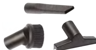
KIT ACCESSOIRES U2-U11-086