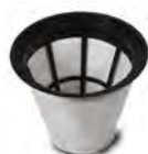
Kit filtre 3833 (FTDP00226)