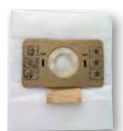
1 x sac microfibre (GP 1/16 A) SA 101 (FTDP00453)