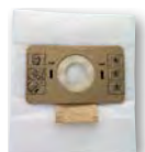
Pochette 10 sacs microfibre SA 10 (GP 1/16)