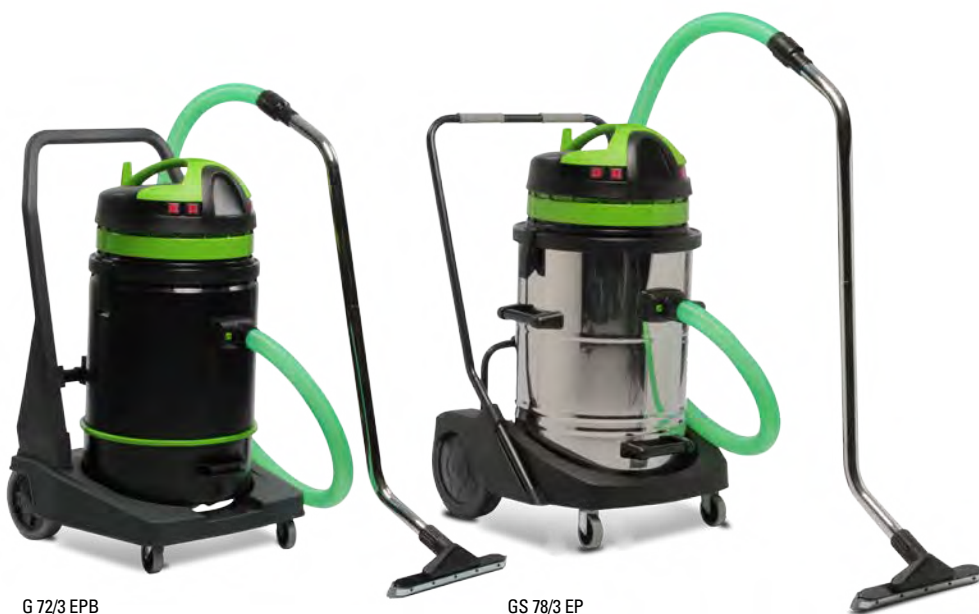
G 72/3 EPB