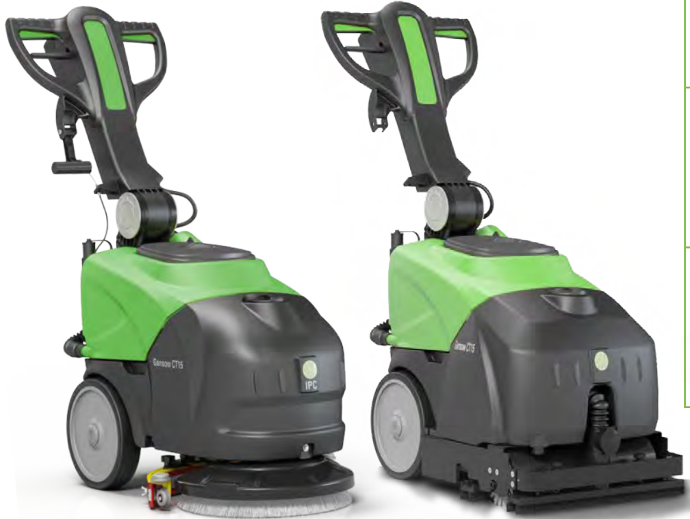
CT15 B 35 CT15 C 35