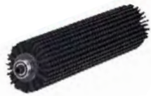
BROSSE A ROULEAU PPL SPPV01552