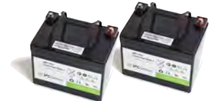
BATTERIE AGM X 2 BAAC00114