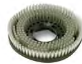
BROSSE NYLON STANDARD Ø 350 SPPV01287