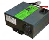
CHARGEUR EMBARQUÉ KTRI02305