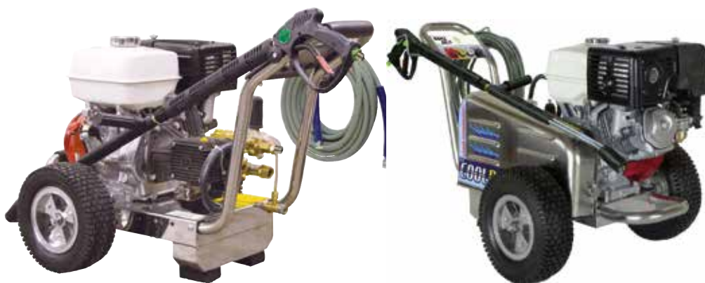
BENZ 280/15 SP95