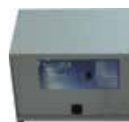
CHARGEUR UNIVERSEL BACA00134 1250E/1280E