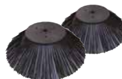
BALAI LATÉRAL PPL STANDARD X 2 SPPV00018