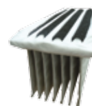
FILTRE POLYESTER (POUR 1280) FTDP00214