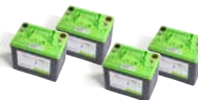
BATTERIE GEL X 4 BAAC00106 1250E/1280E