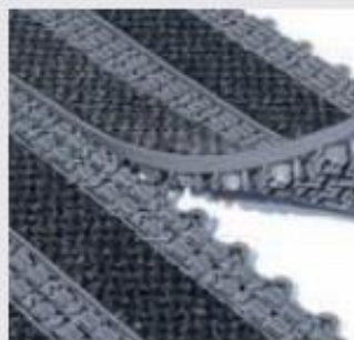
Connexion entre les dalles

100 % PVC avec bandes de moquette en 100% polyamide mono et multi-filaments