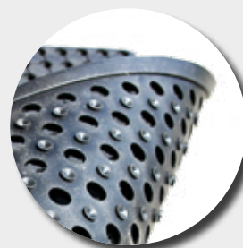
Face inférieure avec ventouses