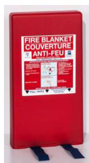
COU 7054 AF 120 x 180 cm