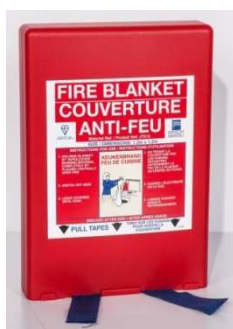
COU 7053 AF 120 x 120 cm