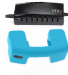
K.1.S.115.0248.797 Batterie : i-power 20L K.1.S.115.1389.0 Chargeur : i-charge