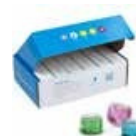
K.120.72.0444.0 i-dose 3/5/7 Panachés