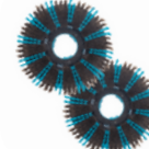
K.2.S.115.1054.592 Brosse poils naturels