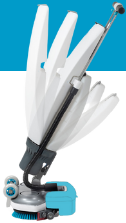
IMOPL.FCT.1100C/F imop Lite CF