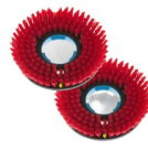
K.2.S.115.1054.1 Brosse dure