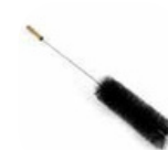
K.1.72.0324.0 Goupillon de nettoyage de bacs