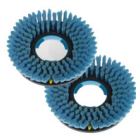
K.2.S.115.1054.70 Brosse souple