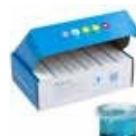
K.120.72.0444.7 E52 Nettoyant quotidien