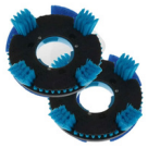
K.2.S.115.1056.797 Plateau porte disque