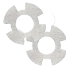
K.20.115.1057.2 Disque blanc nettoyage léger lustrage