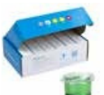
K.120.72.0444.6 E73 Dégraissant