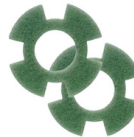
K.20.115.1057.64 Disque vert nettoyage quotidien des sols non-protégés nettoyage en profondeur