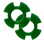
K.2.115.1060.64 Disque Diamant Twister vert nettoyage quotidien des sols en pierre, béton, céramique, vinyle, bois et caoutchouc.