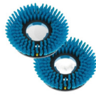
K.2.S.115.1054.797 Brosse standard